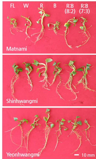
Fig. 2. Effect of different colored light-emitting diodes (LED) on plantlet growth in the in vitro node culture of three sweet potato cultivars ('Matnami', 'Shincheonmi', and 'Yeonhwangmi') after 3 weeks of culture. FL, fluorescent light (control); W, white LED; R, red LED (660 nm); B, blue LED (460 nm); R:B, ratio of red to blue LED light.

육지면(Li et al., 2010)은 적:청(1:1) 혼합 LED에서 양호한 것으로 나타났다. 또한 폐쇄형 식물공장에서도 토마토(Kim et al., 2014), 들깨(Choi et al., 2003), 국화(Im et al., 2013), 파프리카(Lee et al., 2012) 등의 줄기신장은 적색보다 청색 LED에서 양호하고, 상추 품종 '적치마상추'(Lee and Kim, 2014), 'Sunmang' 과 'Grand rapid TBR'(Son et al., 2012), 민들레(Ryu et al., 2012) 등은 적색 LED에서, 그리고 고추냉이(Kim and You, 2013), 상추 'Lollo Rosa'(Shin et al., 2012) 등은 적:청 혼합 LED에서 양호한 생육을 보여 식물종 및 품종에 따라 다른 반응을 보인다는 것을 알 수 있다. 이와 같이 광파장에 따른 줄기신장은 피토크롬과 다른 광수용체들 간 상호작용에 의하여, 식물종이나 품종 간에도 촉진 또는 억제되는 것으로 보이며(Kim et al., 2004a), 식물종 및 품종, 그리고 재배목적에 따른 최적의 광질을 찾는 것이 중요하다는 것을 알 수 있었다.